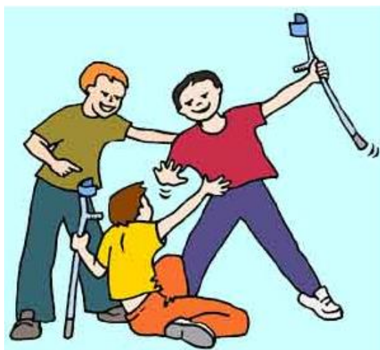
Εικόνα 1

Διατυπώστε τις απόψεις σας μέσω του forum της ομάδας σας.